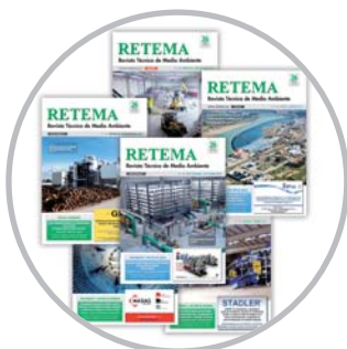
Revista | Magazine

La revista referente del sector medioambiental por su dilatada trayectoria The reference magazine in the environmental sector for his expanded trajectory