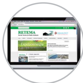
Portal | Website