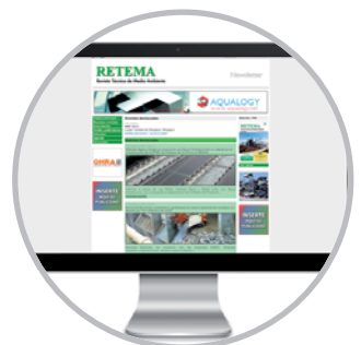
Boletín | Newsletter

La mejor plataforma para su publicidad The best platform for your advertising