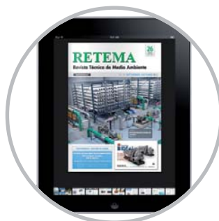
Revista digital | Digital magazine